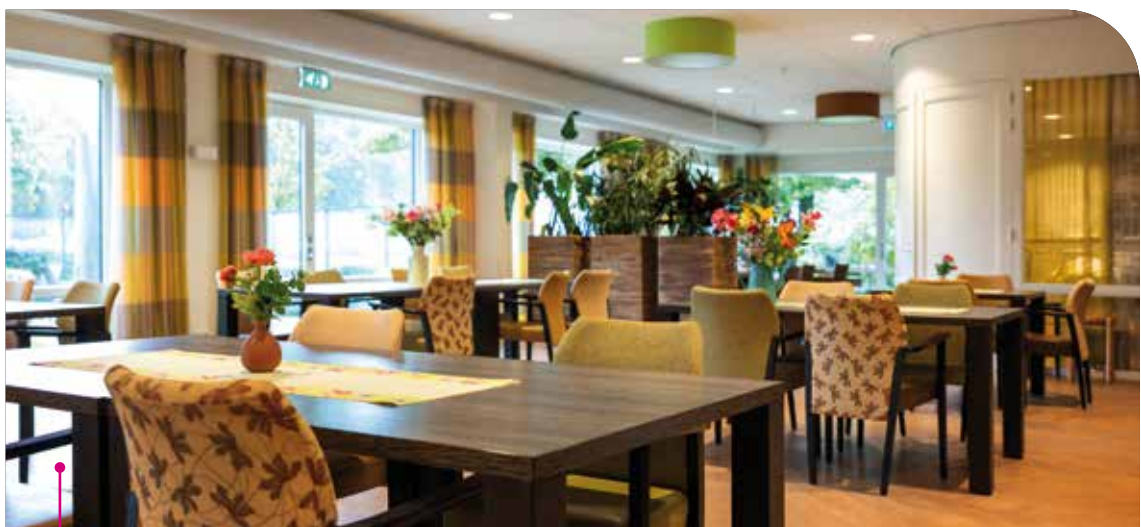
De ontmoetingsruimte op de begane grond.

Het appartement of de zit-slaapkamer wordt gestoffeerd opgeleverd. En is voorzien van vloerbekleding, vitrage en gordijnen. Er staat een goed in hoogte verstelbaar bed en een kledingkast. Er is een oproepsysteem waarmee je 24/7 iemand kunt oproepen als dat noodzakelijk is. Dat geeft een veilig gevoel. Je kunt het appartement verder inrichten met je eigen spullen. Als je behoefte hebt aan privacy, kun jij je terugtrekken in je eigen appartement. Ontmoet je graag andere mensen? Dat is mogelijk in de gezamenlijke ruimtes, op het terras of in de tuin.